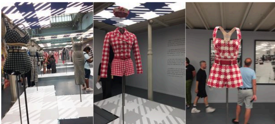
A l'exposition « Azzedine Alaïa, une autre pensée sur la mode. La collection Tati. »

Le style d'Alaïa, reconnaissable entre tous, cultivait le raffinement, le sens du détail, le luxe des matières, la perfection de la coupe qu'il rectifiait dix fois, cent fois, mille fois. Un travail inouï qui se payait cher. Mais l'homme, Azzedine, était tout le contraire du snobisme. Provocateur plutôt, et bienveillant envers toutes les femmes, les pulpeuses, les maigres, les riches, les fauchées. C'est ainsi qu'avec son copain Julian Schnabel, artiste vedette, il a voulu un jour rendre hommage à Tati. Son côté popu, accessible à tous.