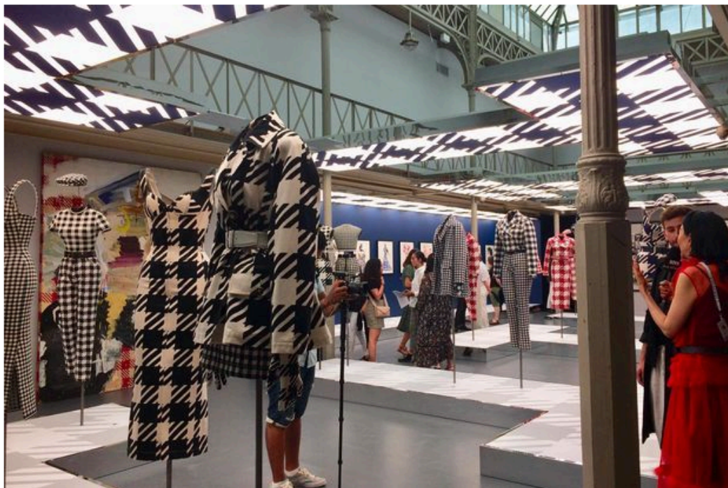
A l'exposition « Azzedine Alaïa, une autre pensée sur la mode. La collection Tati. »

Quand, dans le milieu de la mode, on a découvert ses intentions, - « Quoi ? des fringues imprimées Tati ?! » -, certaines s'en sont étonnées avec leur sautoir Chanel. Eh bien le résultat était formidable. Il avait su s'approprier le pied de coq, le décliner en rouge et noir, en tirer des shorts, des jupes crayon, des vestes et des brassières merveilleusement bien coupés, avec un placement motif impeccable. D'ailleurs, c'est simple, on rêve de les porter aujourd'hui. Indémorable.