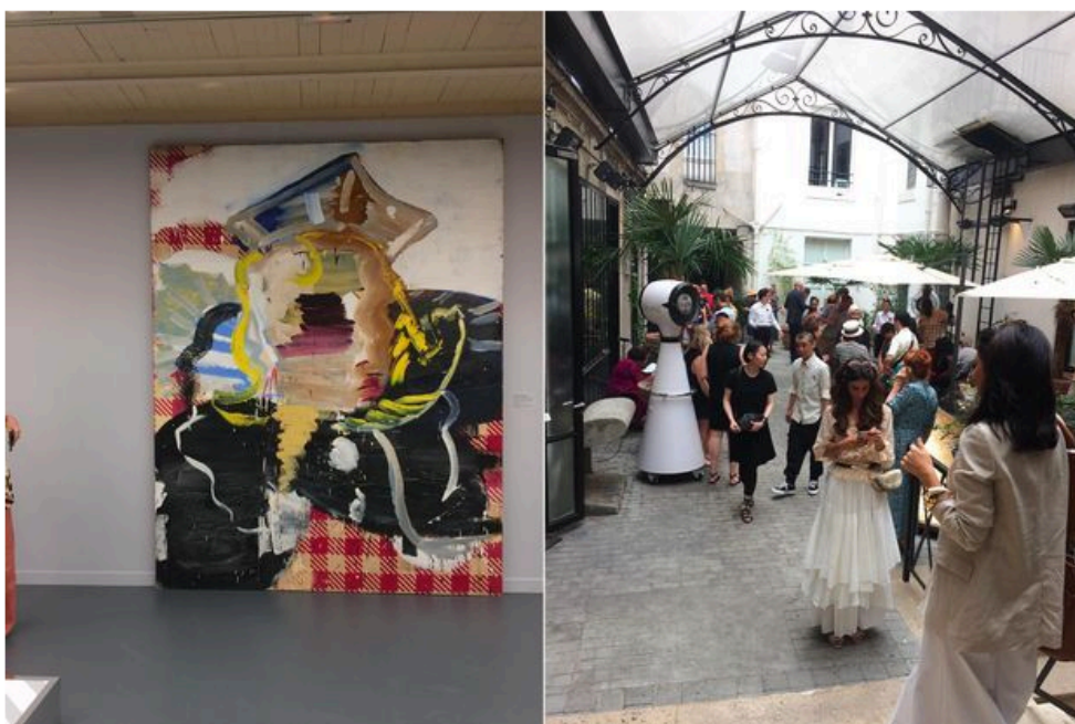
A l'exposition « Azzedine Alaïa, une autre pensée sur la mode. La collection Tati. »