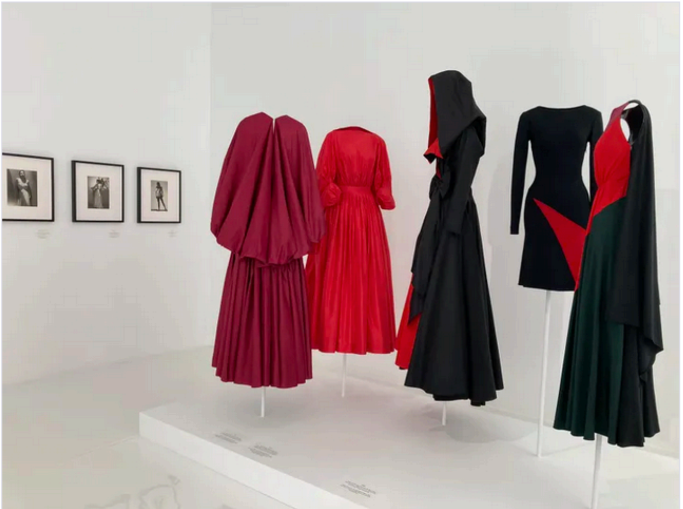
Exposition "Alaïa / Grès, au-delà de la mode" à la Fondation Alaïa (Corinne Jeammet)