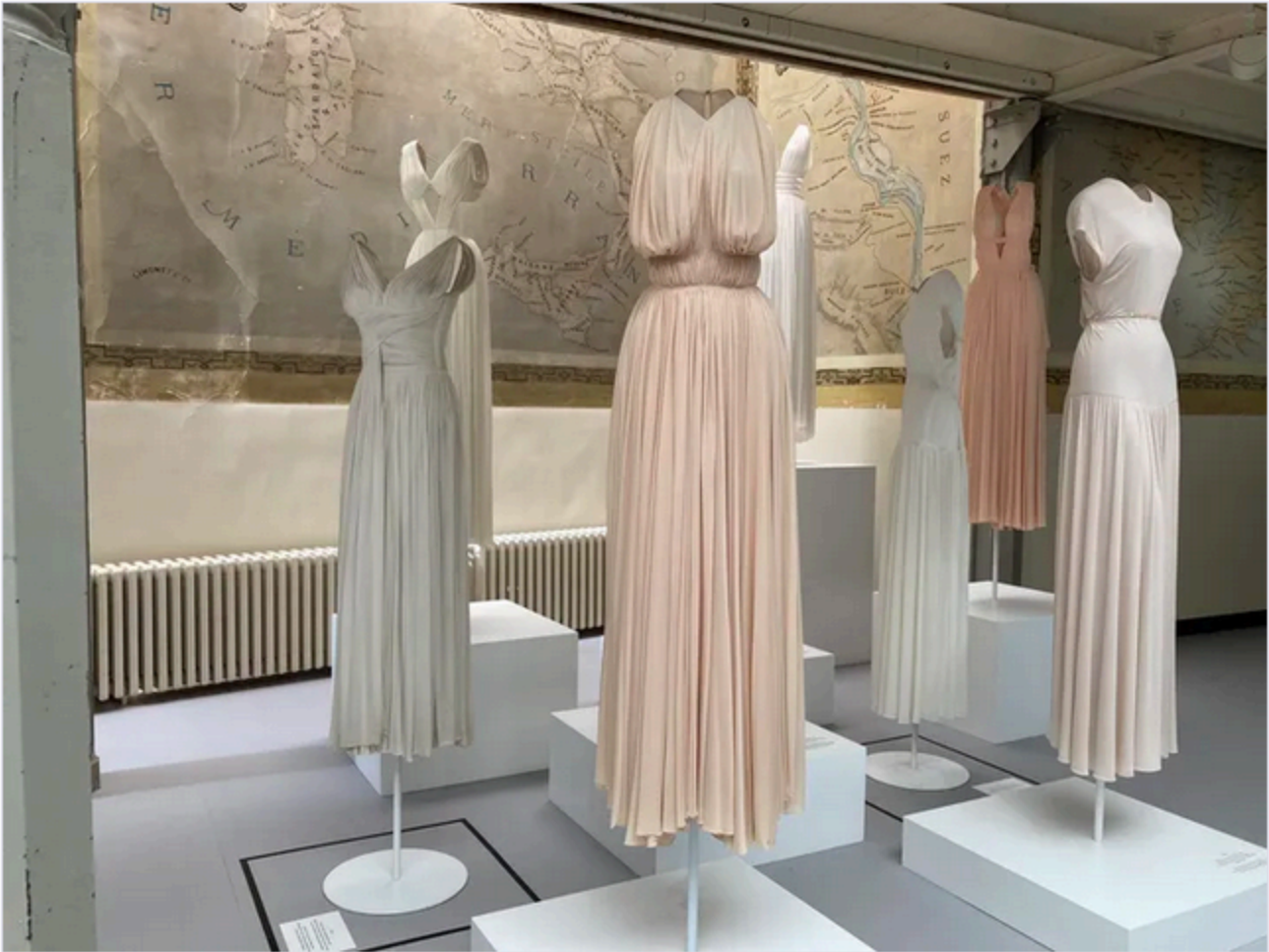
Exposition "Alaïa / Grès, au-delà de la mode" à la Fondation Alaïa

Apôtres d'une certaine forme de dépouillement, leurs créations, d'une apparente simplicité, dissimulent une complexité extrême de coupe et de conception. Les deux couturiers ont épousé une communauté de création et d'esprit : les drapés que Madame Grès avait érigés en art depuis les années 1930 s'incarnent dans les robes longues, fluides et plissées d'Azzedine Alaïa. Le jersey de la couturière se traduit en maille chez le second et l'exigence des proportions et la rigueur de la coupe les unit.