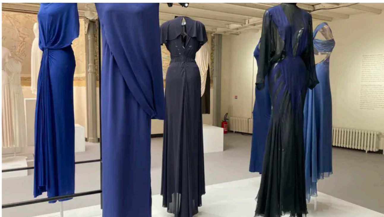
Exposition "Alaïa / Grès, au-delà de la mode" à la Fondation Alaïa (Corinne Jeammet)