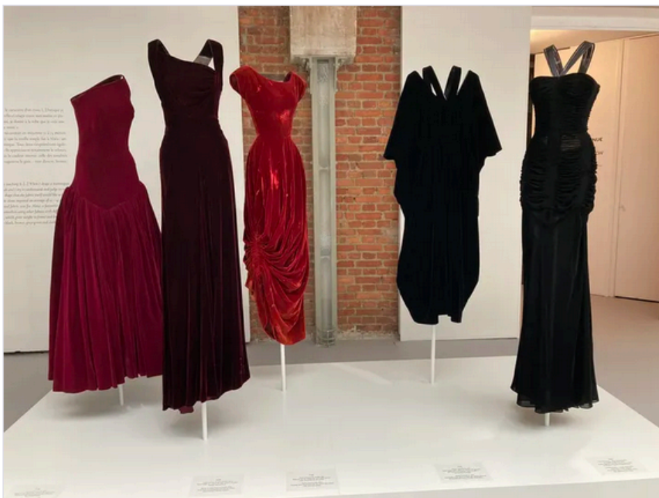
Exposition "Alaïa / Grès, au-delà de la mode" à la Fondation Alaïa (Corinne Jeammet)

Le Palais Galliera accueille prochainement l'exposition Azzedine Alaïa, couturier collectionneur, qui présentera, pour la première fois, sa collection patrimoniale qu'il a réunie au fil du temps !