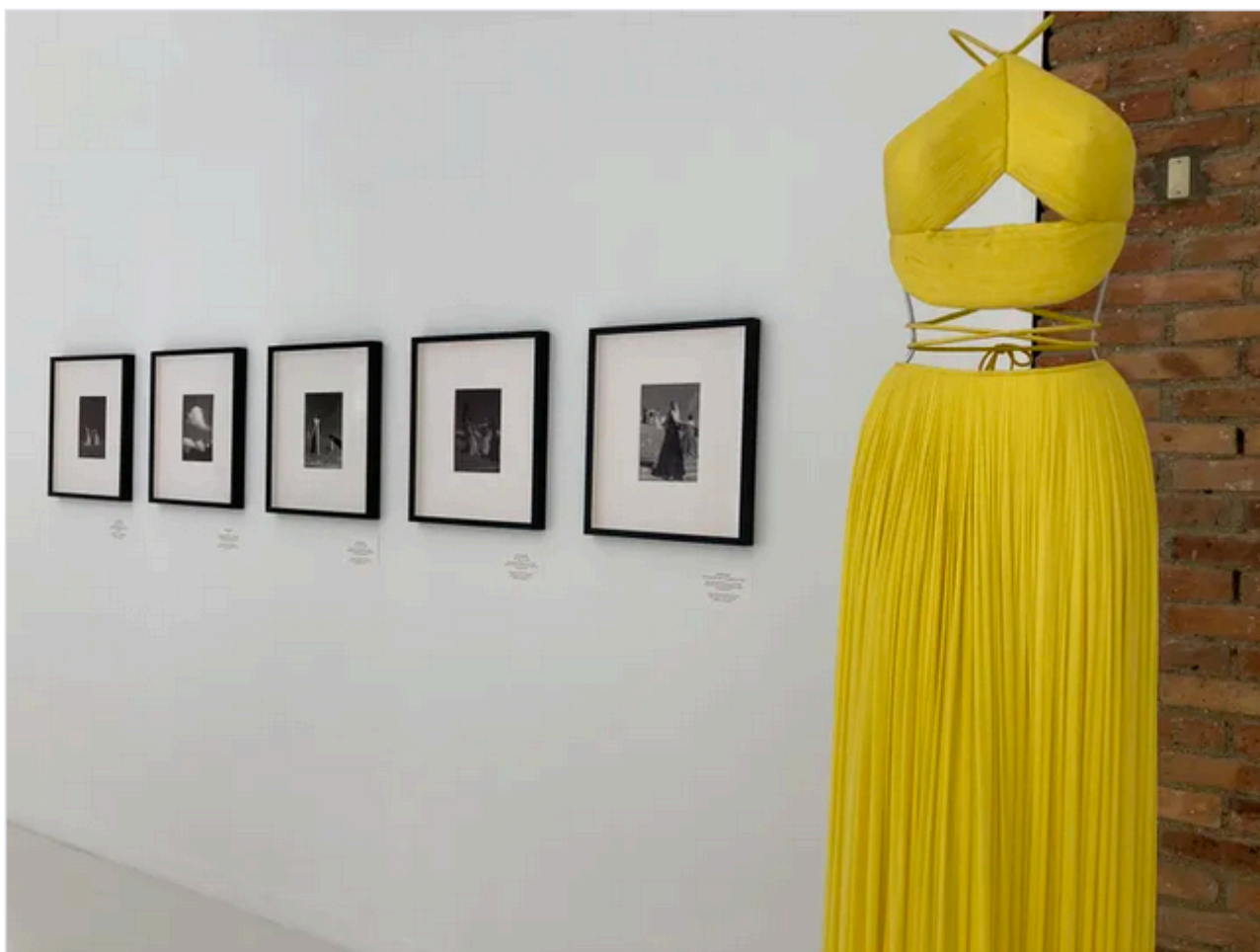
Exposition "Alaïa / Grès, au-delà de la mode" à la Fondation Alaïa (Corinne Jeammet)

La visite se poursuit au premier étage. En haut de l'escalier, une dizaine de photographies en noir et blanc côtoient des modèles colorés - jaune, rouge. Cette pièce permet aussi de découvrir le studio du couturier au travers d'une fenêtre vitrée, de forme ronde.