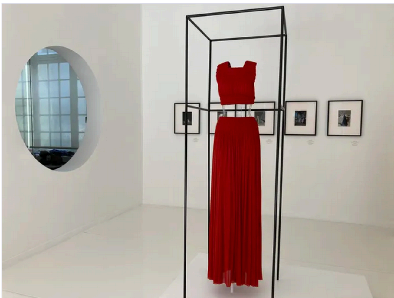
Exposition "Alaïa / Grès, au-delà de la mode" à la Fondation Alaïa