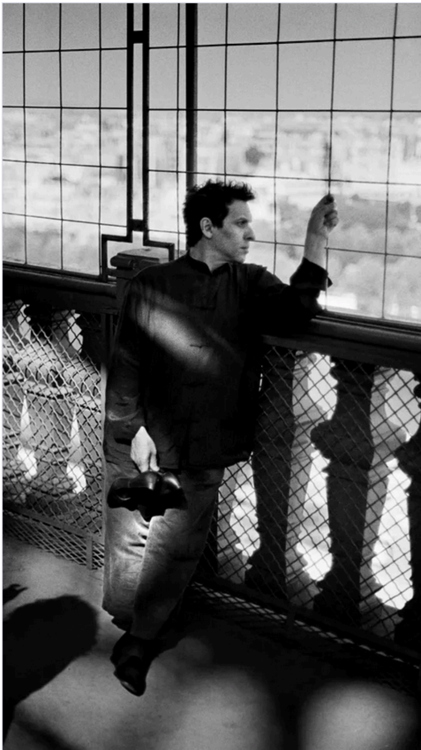
Exposition "Alaïa / Grès, au-delà de la mode" à la Fondation Alaïa (Fondation Alaïa)

Exposition Azzedine Alaïa collectionneur. Alaïa / Grès, au-delà de la mode jusqu'au 11 février 2024. Fondation Azzedine Alaïa . 18, rue de la Verrerie, 75004 Paris.