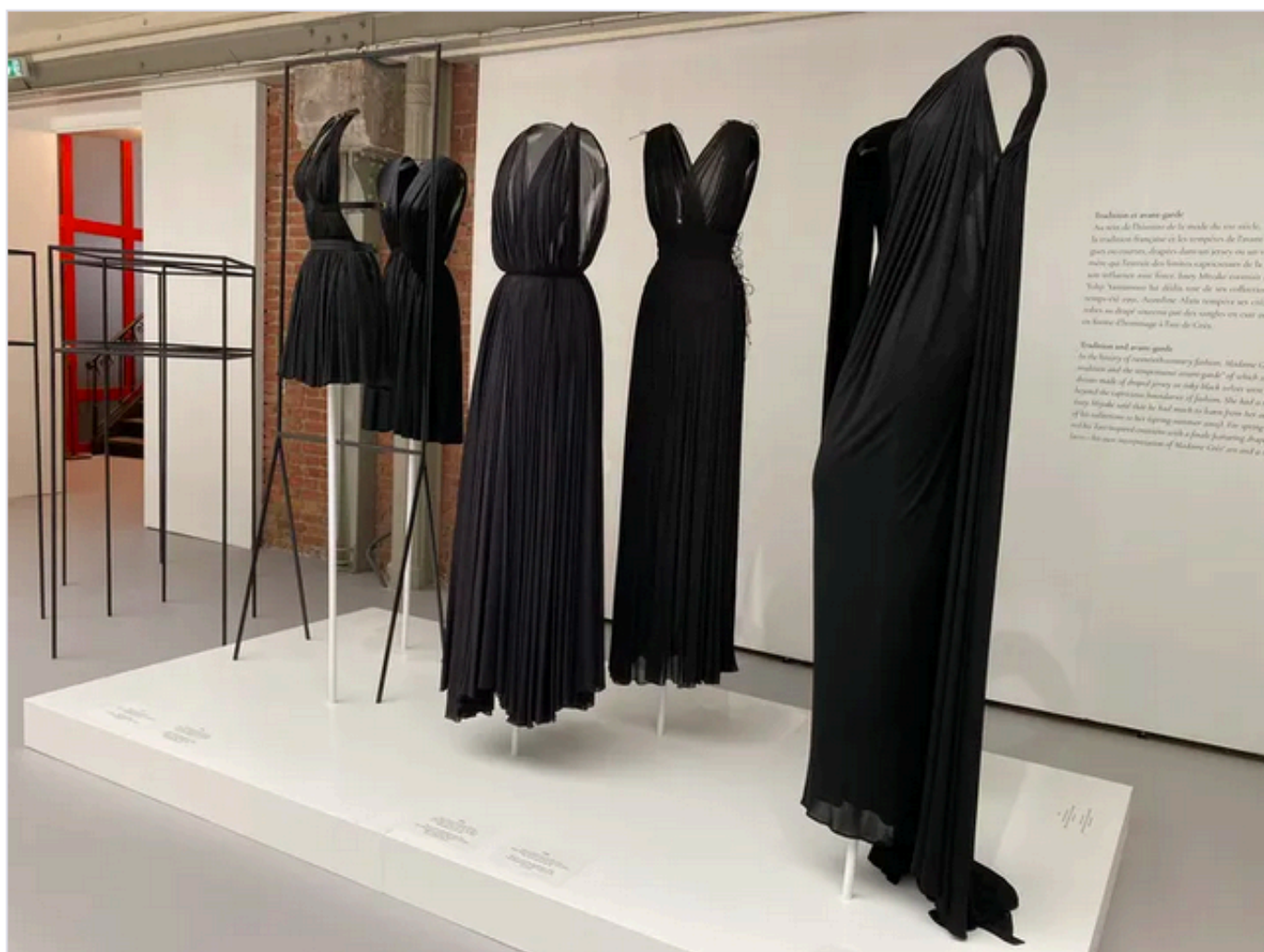
Exposition "Alaïa / Grès, au-delà de la mode" à la Fondation Alaïa (Corinne Jeammet)