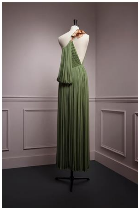
SCAD Atlanta – Spring 2023 – Exhibitions – "Madame Gres: The Art of Draping" – Olivier Saillard, curator – Documentation – SCAD FASH – Photography Courtesy of SCAD Courtesy of SCAD

À travers ses 60 pièces inédites, le parcours de l'exposition retrace la genèse de la vision de ces deux figures emblématique du monde de la couture, qui à travers leur histoire personnelle et leur apprentissage, continuent d'influencer la mode contemporaine.